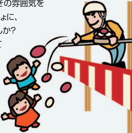
甲田建設前特設会場

今ではみられなくなった 上棟式での餅まきの雰囲気 みなさんといっしょに、 体験してみませんか? ご来場お待ちしております。